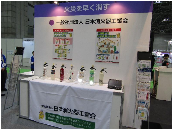
(一社) 日本消火器工業会