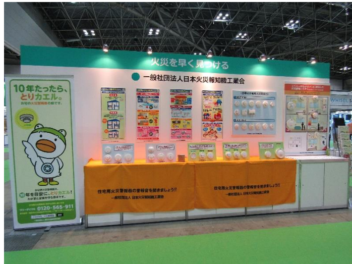
(一社) 日本火災報知機工業会