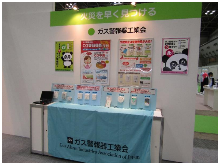
ガス警報器工業会