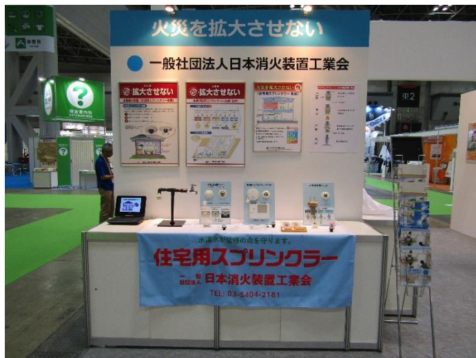
(一社) 日本消火装置工業会