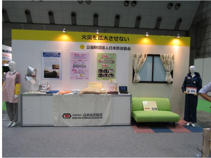
(公財) 日本防災協会