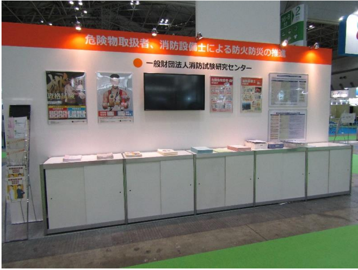
(一財) 消防試験研究センター