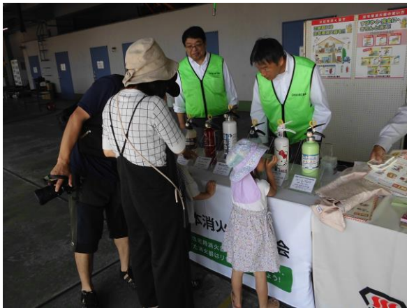
(一社)日本消火器工業会