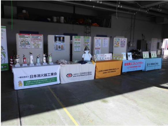
住宅用防災機器展示ブース