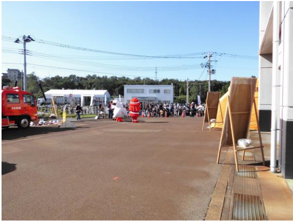
開場を待つ市民のみなさん