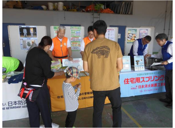
(一社)日本火災報知器工業会