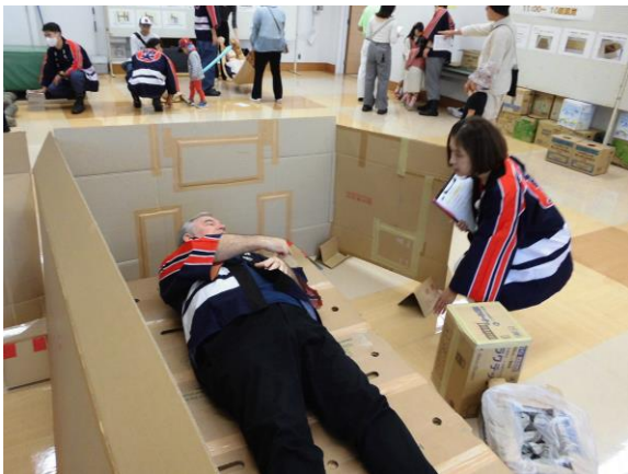
段ボールベッド体験の様子