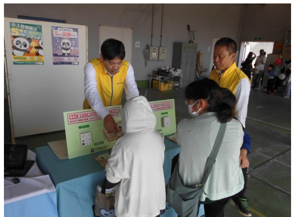
ガス警報器工業会