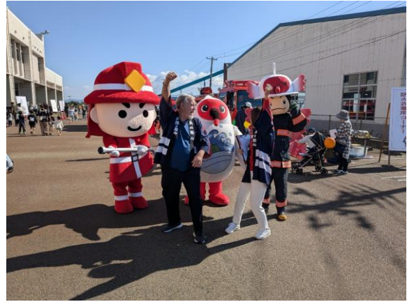
オープニングの撮影の様子