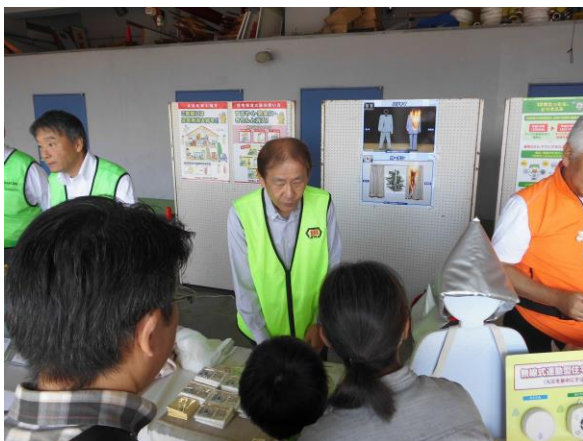
(公財)日本防災協会