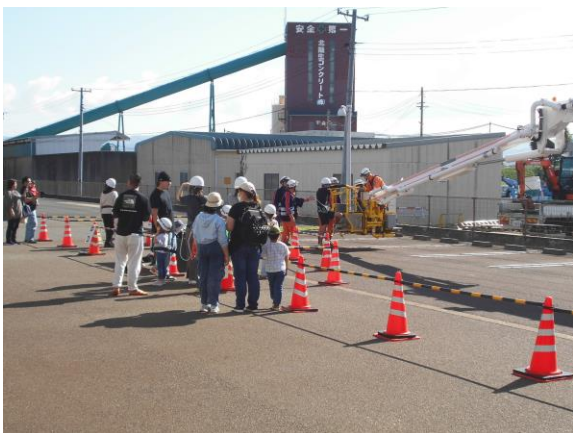
大好きなはしご車の試乗体験を待つ