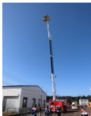
エンディング撮影の様子