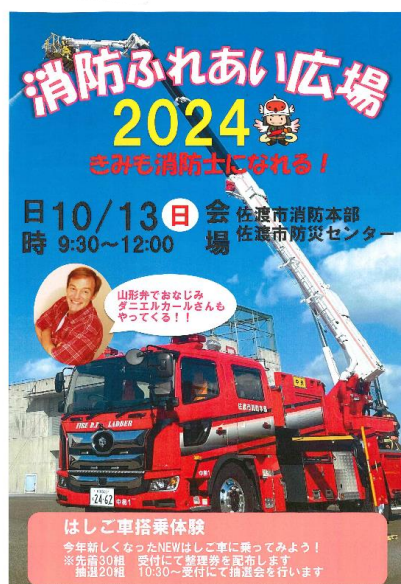
開催広報用チラシ