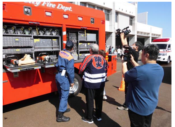
車両紹介の撮影の様子