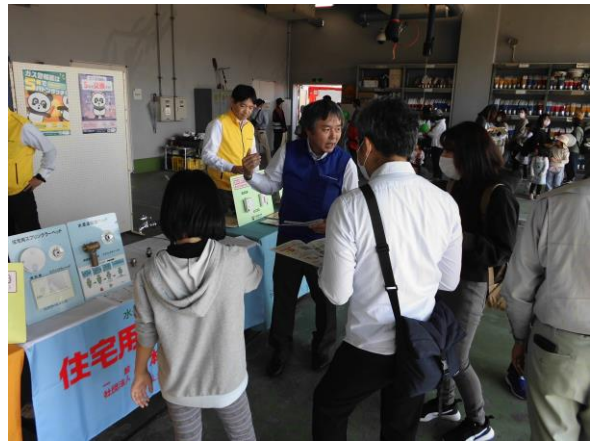
(一社)日本消火装置工業会